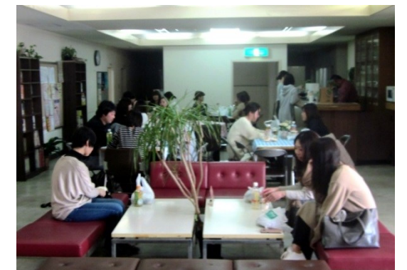
(休憩時間の様子。喫茶コーナーでの、100円コーヒー飲み放題もご利用できます)

お申込時いただきました個人情報につきましては、研修会の実施・運営、研修会のご案内の送付、大阪府からのお問合せ対応・報告等、研修運営上の範囲内で利用いたします。